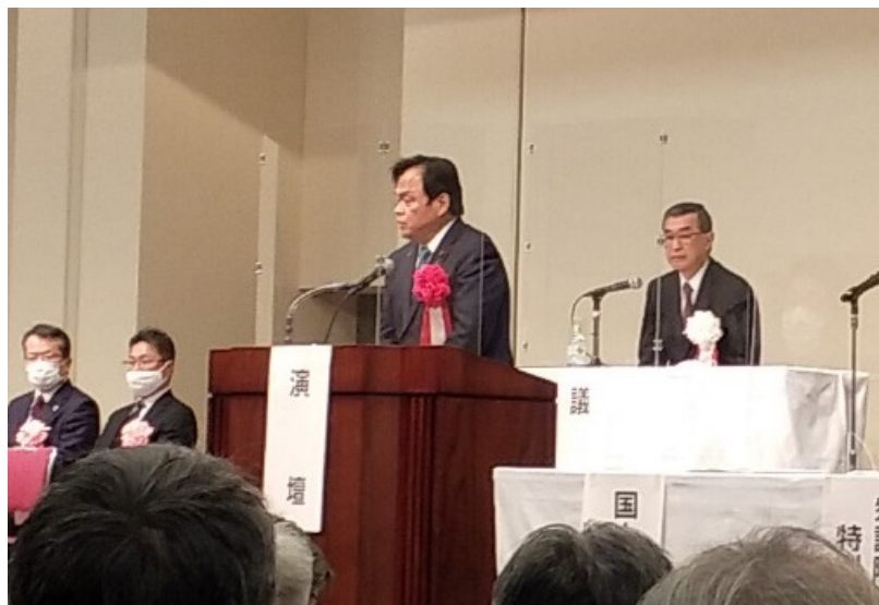
赤羽一嘉国土交通大臣によるご挨拶